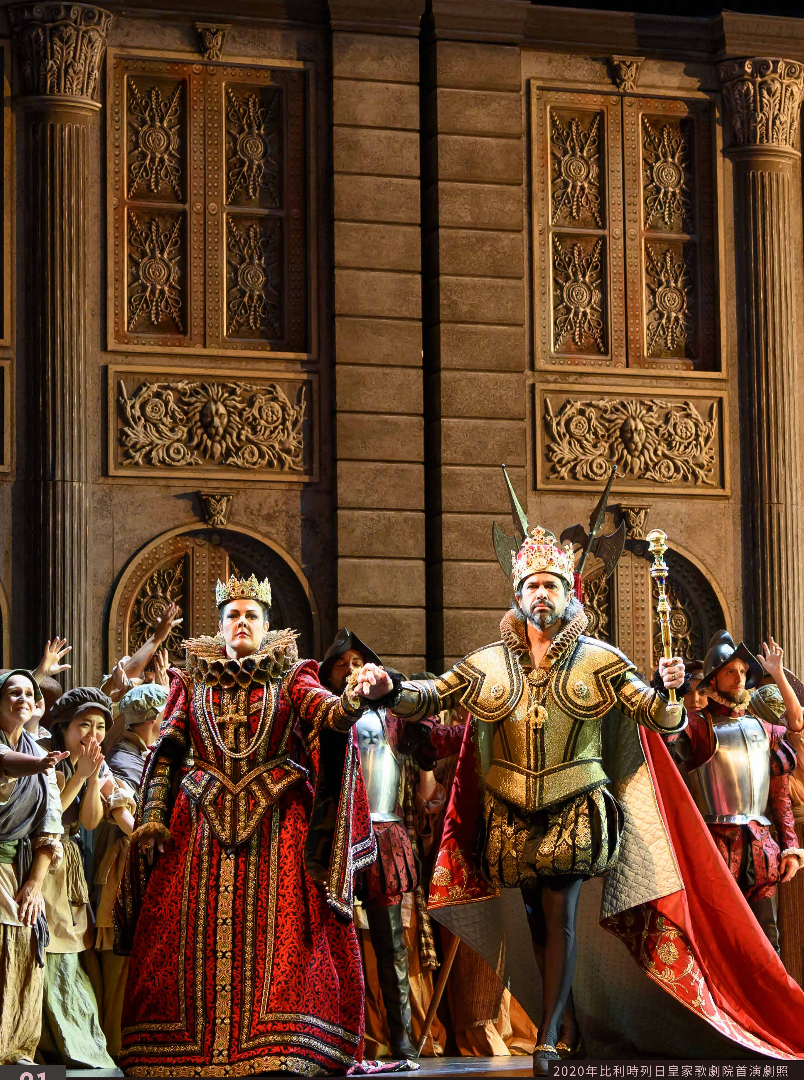
2020年比利時列日皇家歌劇院首演劇照